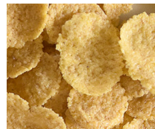
Cornflakes germes de blé