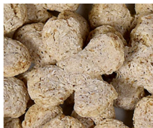
Trèfle à 4 feuilles