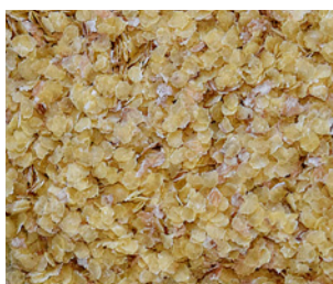
Germes de blé