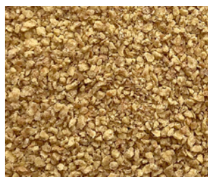
Granulés de germes de blé