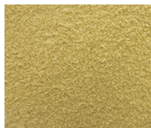
Farine de germes de blé, fine