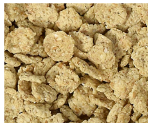
Flakes au concentré de jus de poires et cannelle